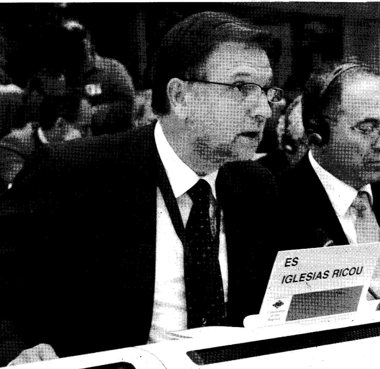
Intervención de Marcelino Iglesias en el plenario del Comité de las Regiones.

A su vez, el presidente de Aragón, Marcelino Iglesias, participó, ya por la tarde, en el plenario del Comité de las Regiones con un dictamen sobre infraestructuras europeas. En el mismo se plantea la ampliación de los grandes itinerarios a los nuevos países de la Unión Europea y una mayor celeridad en el desarrollo de los proyectos contemplados