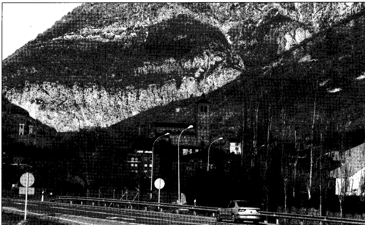
La TCP por el macizo del Vignemale y con embocadura en Biescas -en la foto- es una opción con muchos defensores. D.A.