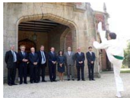
Los presidentes de los territorios que integran la CTP han presenciado el tradicional auresku

Así lo ha indicado este jueves el presidente de Languedoc-Roussillon, Georges Frêche, que mañana tomará posesión como nuevo presidente de la CTP, en el palacio bilbaíno de Artaza, donde se ha celebrado la primera reunión del Consejo plenario bajo el lema "25 años creando espacios de encuentro". Durante su intervención, Frêche ha destacado su voluntad de ejecutar, entre otras infraestructuras, una conexión entre Toulouse y Zaragoza.