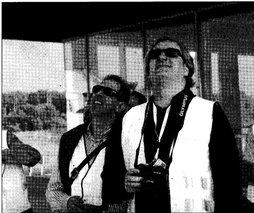
El gerente de Pyrenair, a la derecha, siguió con atención el aterrizaje. VÍCTOR IBÁÑEZ