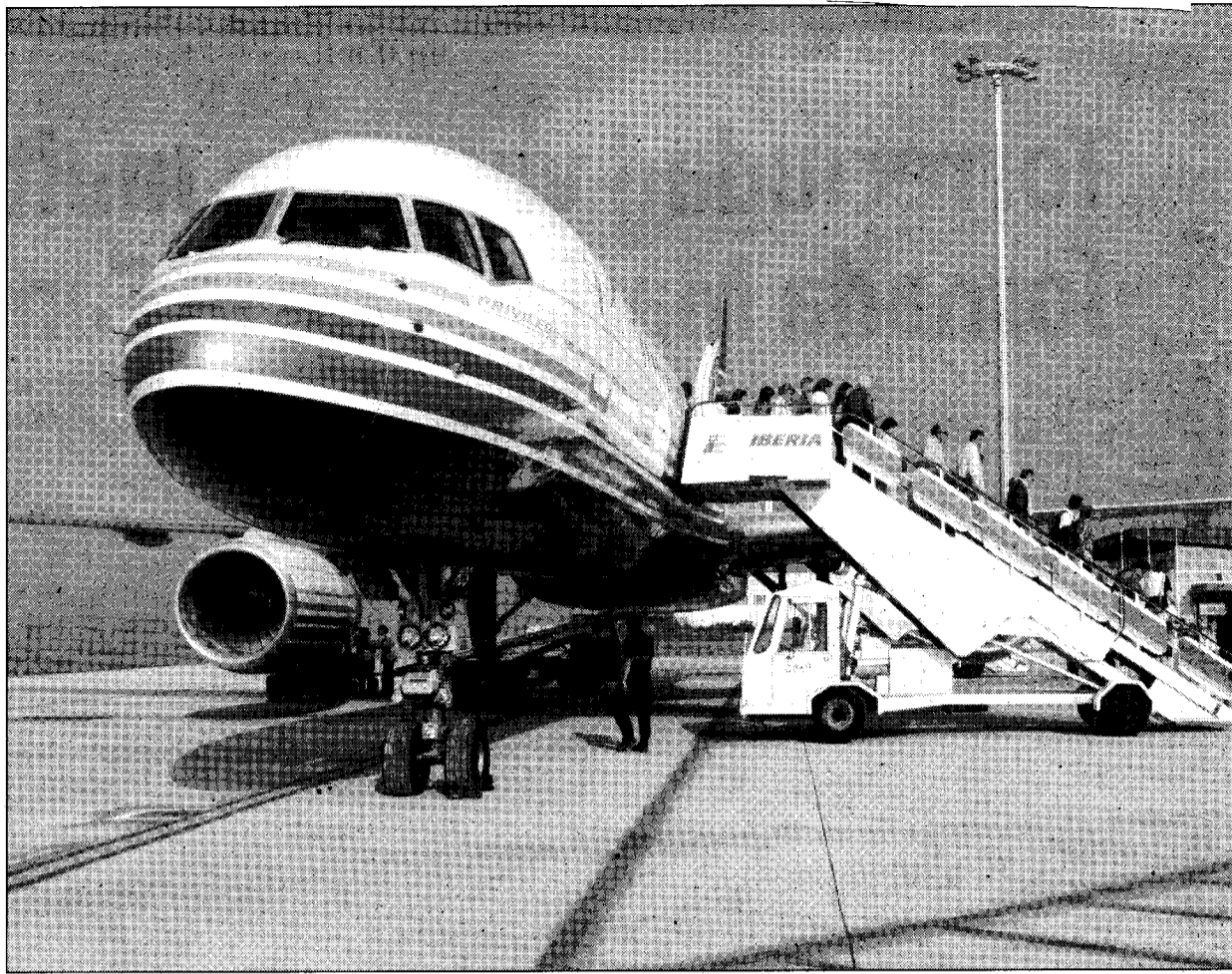
El aterrizaje en la pista oscense se produjo, incluso, antes del horario previsto.