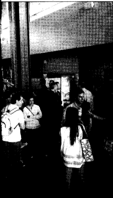
la expectación que generó su llegada. VI.