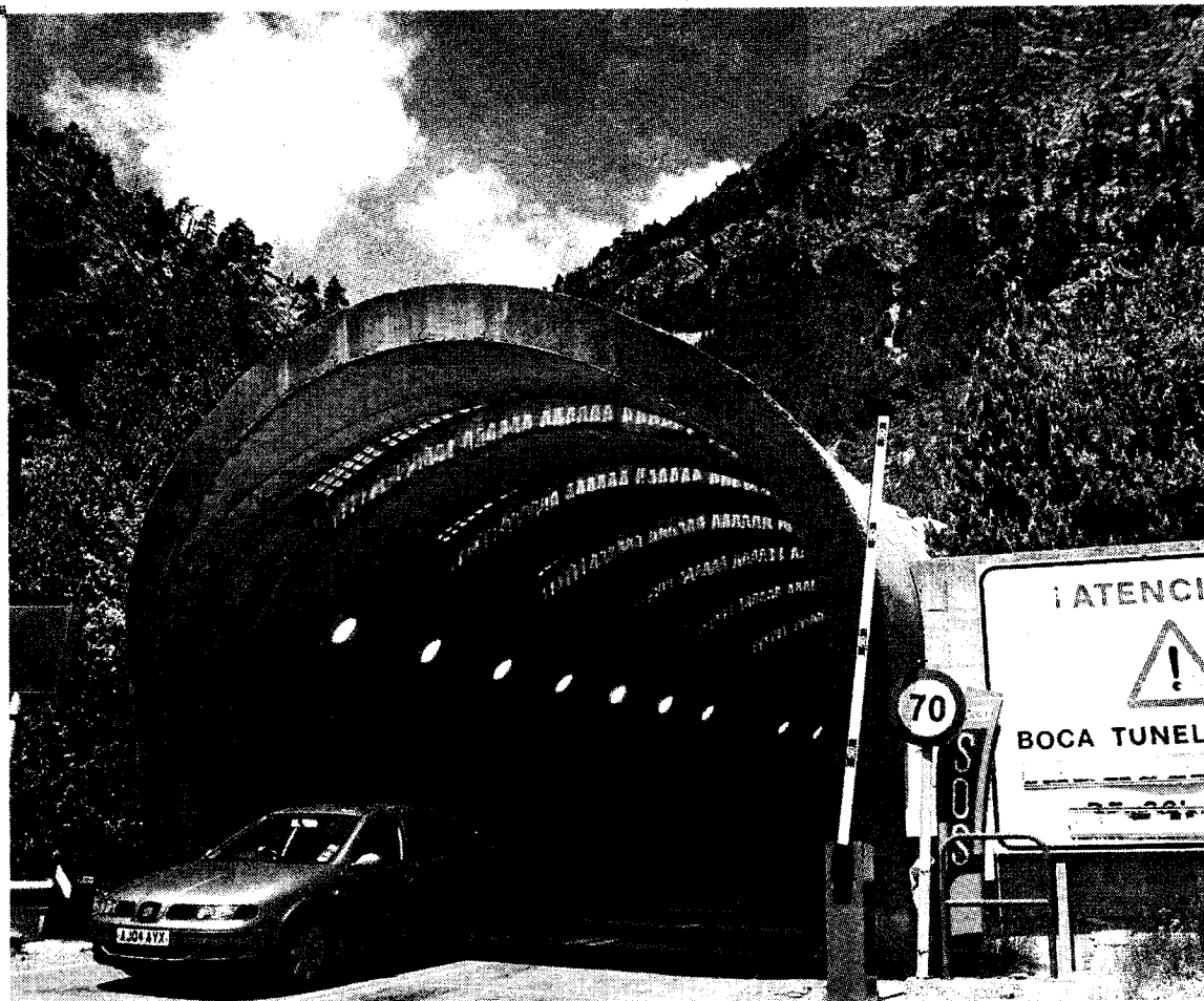
Imagen de la boca aragonesa del túnel de Bielsa. En el otro lado, se instalaría el remonte. PEDRO ETURA

HUESCA. El Gobierno de Aragón y el Conseil de Hautes-Pyrénées estudian unir a través de un telesilla la boca francesa del túnel de Bielsa con la estación de esquí de Piau-Engaly, situada al otro lado de la frontera. Ambas Administraciones han mostrado su voluntad política de potenciar este proyecto, que convertiría a Bielsa y a otras localidades de la comarca de Sobrarbe en el centro hostelero para los esquiadores que acudan a disfrutar de la nieve a la parte francesa, que carece de suficientes infraestructuras.