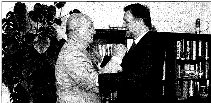
Joaquín Almunia y Marcelino Iglesias se saludan con motivo de la reunión que mantuvieron. S.E.

Asimismo, las regiones demandaron "ser más visibles" en la elaboración de las políticas europeas, ya que los gobiernos regionales son los encargados de "hacer la transposición" de dichas medidas. "Hay que tener en cuenta que dos terceras partes de las inversiones que se hacen en Europa hoy son de las regiones y de las ciudades", subrayó Marcelino Iglesias.