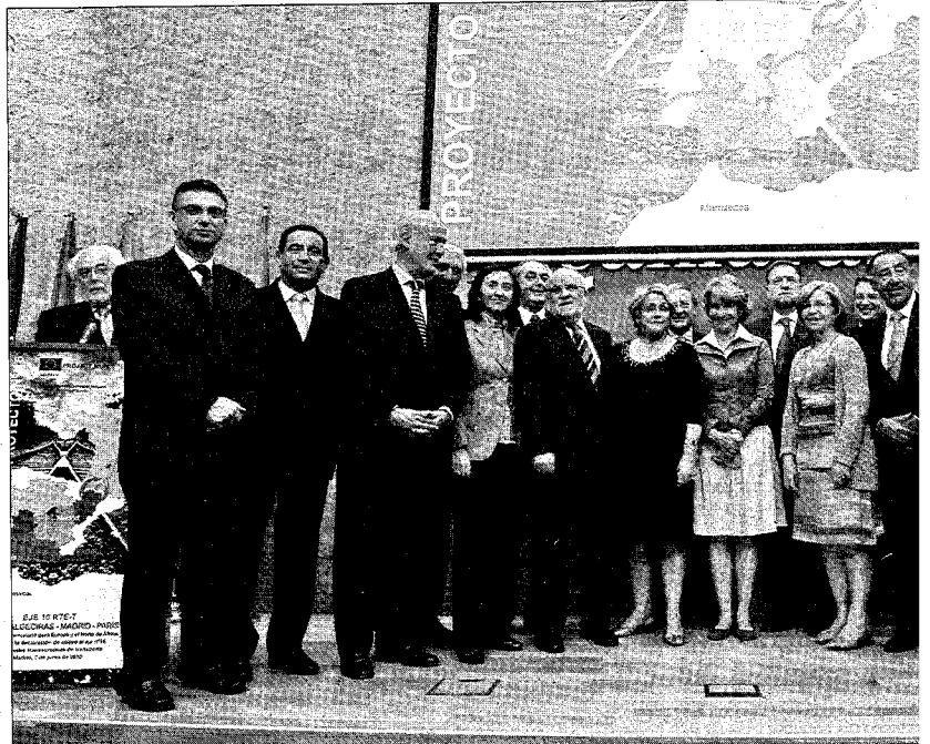
Foto de familia de autoridades políticas y empresariales asistentes al acto de la firma del documento de apoyo a la TCP. S.E.

Asimismo, aseguró que la puesta de la "primera travesía" que supuso el acto de ayer en Madrid, apoyado por la totalidad de las Cámaras de Comercio de las comunidades afectadas, se podrá fijar en la próxima reunión de los ministros de Transporte de toda Europa, que se darán cita en Zara-