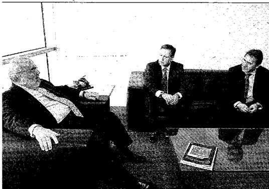
Iglesias con el presidente del Consejo de Cámaras de Comercio y el de la de Zaragoza, S.E.

“Para España y Portugal, este eje supondrá un enorme impulso a la vertebración de nuestras propias comunicaciones internas y, además, permitirá aprovechar de forma mucho más eficiente nuestra posición clave en las rutas mundiales de navegación aérea y marítima”, manifestó. Señaló que el túnel de los Pirineos diversificará las comunicaciones terrestres con el resto de Europa, y descongestionará los actuales pasos ferroviarios de Irún y de la Junquera, que están separados por casi 700 kilómetros de frontera “que durante mucho tiempo ha sido infranqueable por el ferrocarril”.