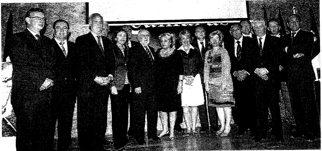
►► Un acto masivo en Madrid sirvió para respaldar una declaración que es el acto en defensa de la travesía más importante hasta la fecha.

APOYO DE MARRUECOS / Por eso, Marruecos estuvo ayer presente en la firma de esta declaración, al igual que Portugal y Francia (este país, en contra de lo que reclaman fervorosamente sus vecinos del sur, es por el momento el que más trabas pone a la ejecución de una obra que cuenta con financiación para los estudios técnicos). Además de estos países y las comunidades de Madrid, Extre-