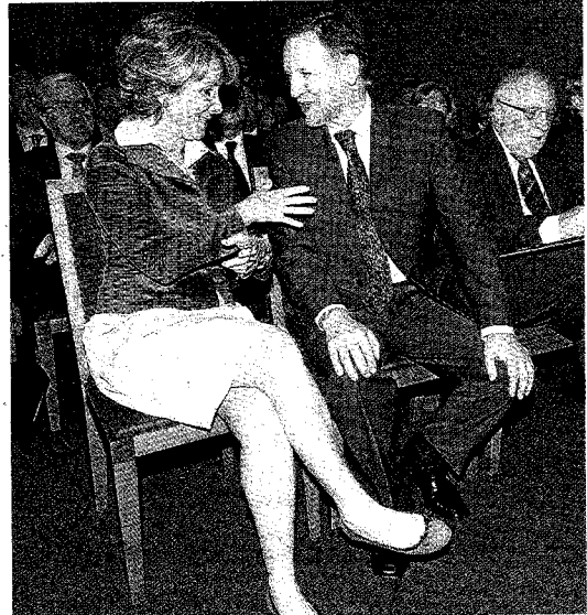
►► Aguirre e Iglesias no disimularon su alianza en favor del proyecto.

to son la apuesta preferida del Ejecutivo galo.