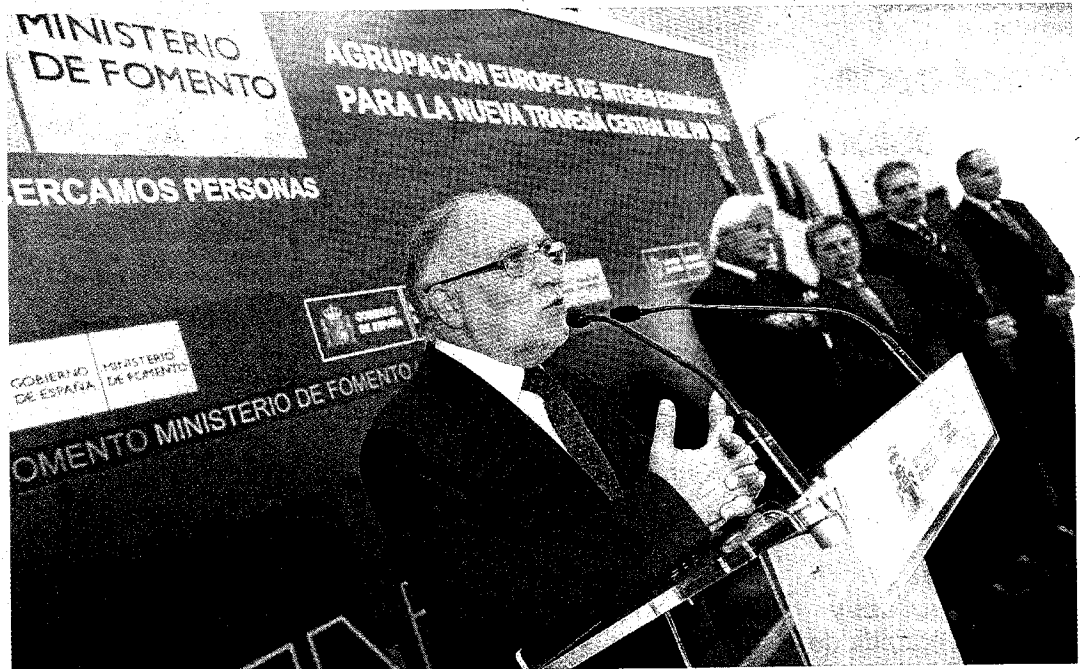
► El secretario de Estado de Infraestructuras, Víctor Morlán, el día que se creó la Agrupación Europea de Interés Económico de la Travesía Central.

AL MENOS 10 AÑOS # Todos veían la necesidad de impulsar este eje de comunicación, pequeños logros que ahora tendrán mayor consistencia si se transmite a Europa que tiene más posibilidades que alternativas como el corredor por el Mediterráneo, que aún no está entre los ejes prioritarios de la Unión Europea, o el eje Vitoria-Dax. Entre tanto se constituyó la Agrupación Europea de Interés Económico (AEIE) entre