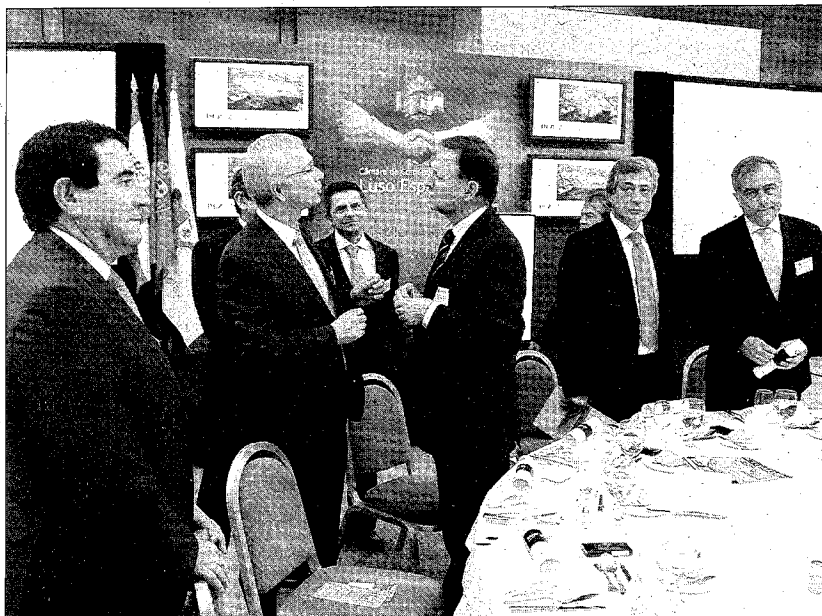
Iglesias se reunió con doscientos empresarios en un acto organizado por la Cámara de Comercio e Industria Luso-Española, S.E.

La visita de Marcelino Iglesias se enmarca dentro de la ronda de contactos que el presidente está llevando a cabo para recabar apoyos a la Travesía Central del Pirineo, un proyecto respaldado por los Gobiernos de España y Francia. El pasado octubre, realizó una visita oficial a Marruecos, donde se reunió con el primer ministro del Reino marroquí. Ambos gobiernos firmaron un acuerdo en el que apoyan la creación del Eje 16 de las Redes Transeuropeas de Transporte. La semana pasada, este corredor sumó un nuevo apoyo, cuando representantes empresariales y políticos del norte de Francia, así como el presidente de la plataforma logística Delta 3, una de las más importantes del norte del país, firmaron una declaración de apoyo a la puesta en marcha del Eje 16.